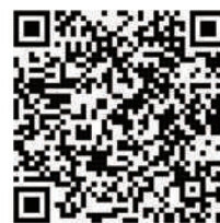
2024年14天 活動執行影片

在「Use實際運用」的階段，將依照學生不同程度給予不同任務卡 Task Cards，在PNU助教帶領到所指定的餐廳或商店，協助學生完成所需執行的會話任務，學生依照任務卡完成每一任務，老師會在學生專屬的學習卡「Rewards Card」簽名。